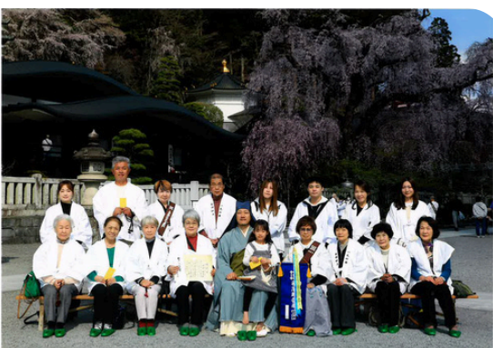
妙福寺 第15回祖廟輪番奉仕記念 令和8年3月28日

三月二十八日、身延山輪番奉仕へ行って参りました。三年続けての参拝となりましたが、今年はめずらしく晴天に恵まれ、総勢十八名でのびやかに参りすることができました。ちょうど桜も満開で、春の身延山をゆっくりと味わうひとときとなりました。なお、住職は自他ともに認める雨男。今回ばかりは皆さまに驚かれましたが、帰り道にはしっかりと雨が降り、「やっばりな」と笑いながらの帰路となりました。来年は令和九年三月二十七日を予定しております。年に一度の身延山へのご奉仕、ぜひご一緒にお参りいたします。